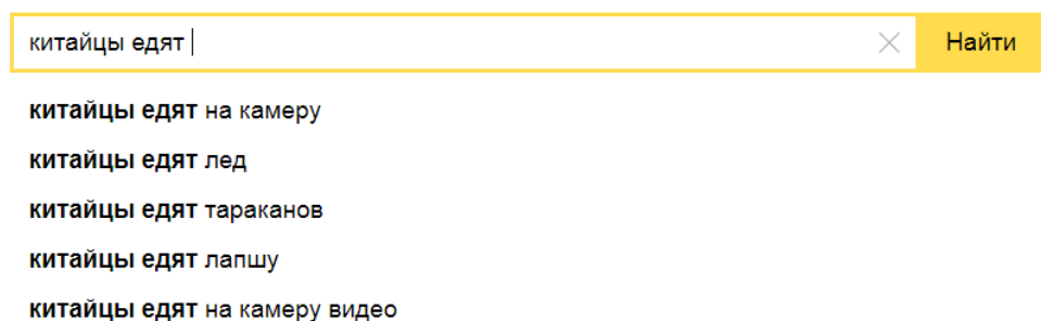
Рисунок 1. Скриншот поискового запроса в yandex.ru на примере китайцев, сделанный нами в 2019 году

На данном этапе в поисковых сервисах google.ru и yandex.ru нами вводился запрос, сформированный по типу «%ethnic_groups% едят», где %ethnic_groups% – название этноса, например китайцы. При этом сервисы, благодаря интеллектуальной системе, предлагали выбрать продолжение запроса из списка наиболее часто встречаемых у других пользователей сети Интернет. Как мы видим за год популярные интернет-запросы россиян по типу «китайцы едят...» уже изменились. (См. Рисунок 1 и Рисунок 2)