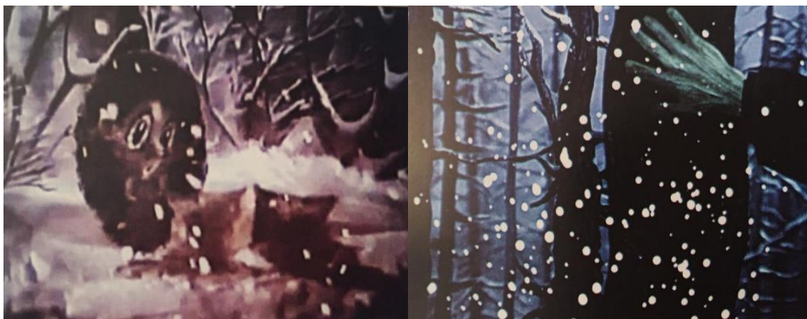
Рисунок №2. Кадры из м/ф «Новогодняя история»

Важно отметить о характерной и оригинальной стилистике, технологии художника Шамиля Наджафзаде, которая использовалась в анимации этого фильма. Успех художнику приходит не сразу (Велиева, 2014, стр. 3).