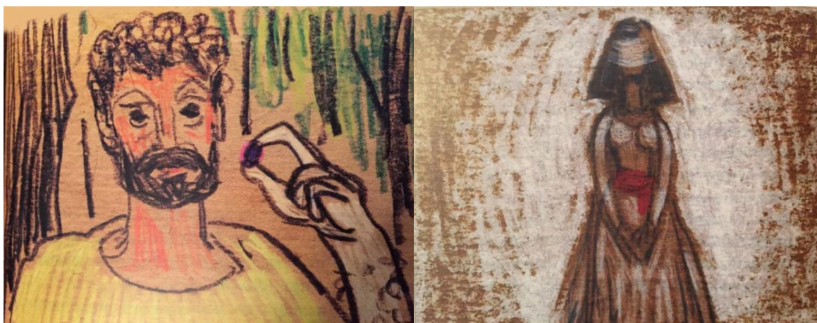
Рисунок № 4. Раскадровка к нереализованному фильму «Зерно»

Успехом Ш. Наджафзаде в этом мультфильме является то, что он очень оригинально соединил сюжетную идею с оригинальной технологией в анимации. В фильме была использована многоярусная перекладная анимация, что создавало органичность и смысловую значимость для комбинированных съёмок (Мехтиева, 2016, стр. 3).