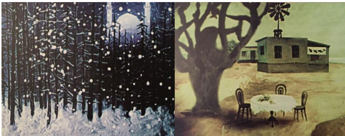
Рисунок №3. Кадры из м/ф «Итхаф» («Посвящение»)

Каждый эпизод в мультфильме несёт ключ к разгадке. Увлечение художника суфизмом отразилось и в его творческом самовыражении.